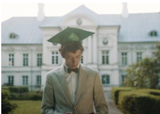
Zaļenieku komerciālā un amatniecības vidusskola

ZKAV direktors pēc Stratēģijas saskaņošanas ar Jelgavas novada pašvaldības Izglītības pārvaldes vadītāju nodrošina tās izpildes uzraudzību, progresu novērtēšanu un turpmāko īstenojamo plānu precizēšanu katrā no attīstības prioritārajiem virzieniem.